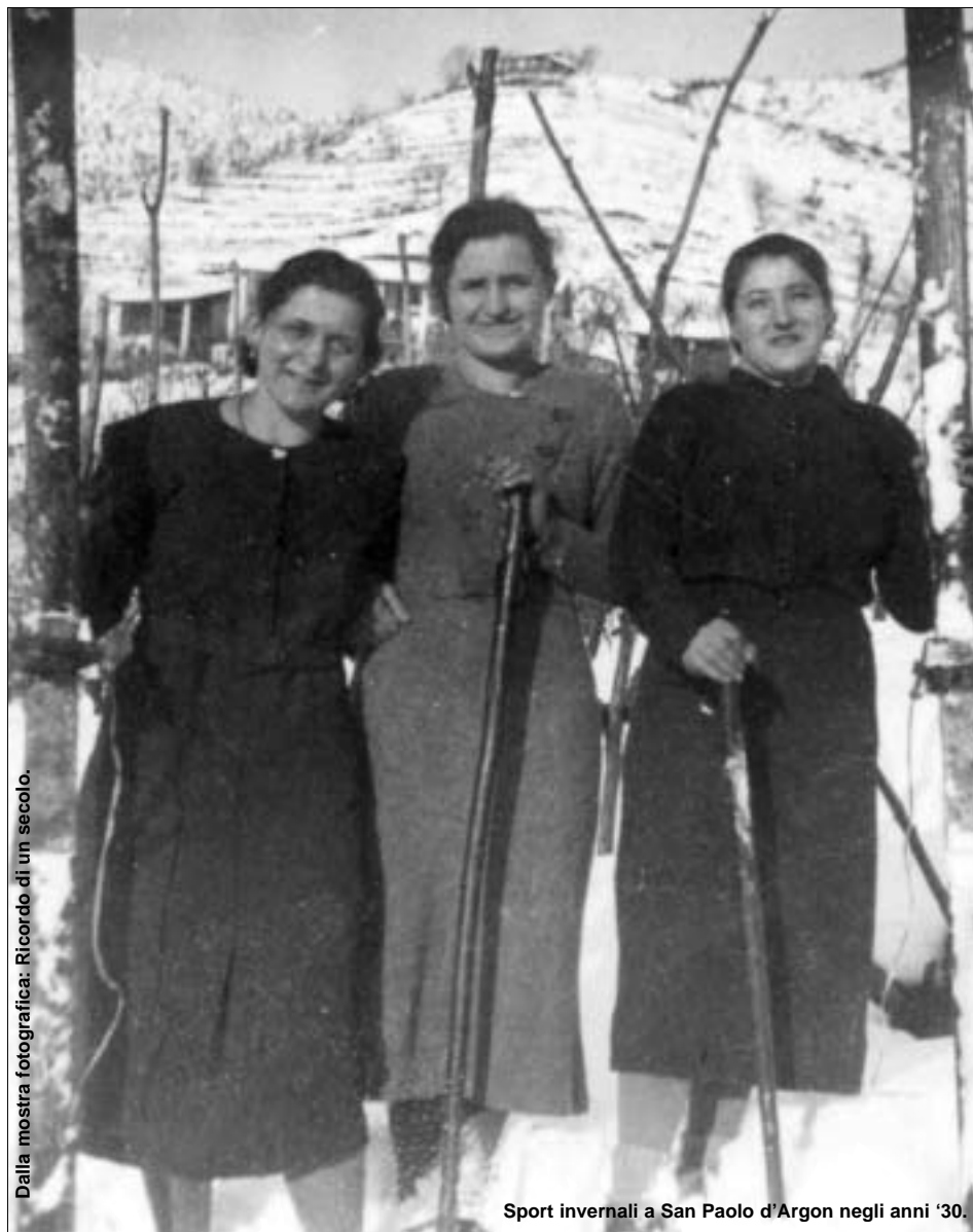
Dalla mostra fotografica: Ricordo di un secolo.

E-mail: argo@comune.sanpaolodargon.bg.it