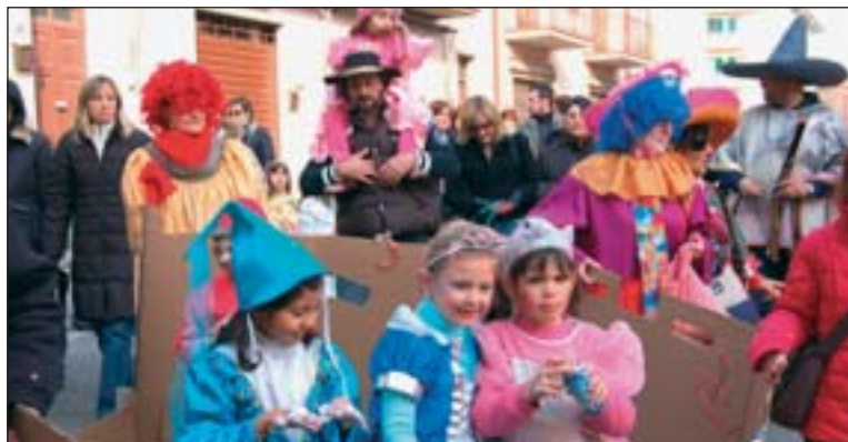
Bambini e adulti insieme per il carnevale di San Paolo