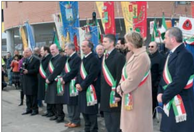
I Sindaci dei Comuni aderenti al Consorzio durante l'inaugurazione

I Sindaci dei Comuni che aderiscono al Consorzio del Corpo di Polizia intercomunale dei Colli hanno presenziato, insieme al Prefetto Cono Federico, al Presidente della Provincia Valerio Bettoni, all'Assessore regionale Massimo Ponti, all'inaugurazione della nuova sede allestita in quel di Albano Sant'Alessandro, nei pressi del bivio della strada statale.