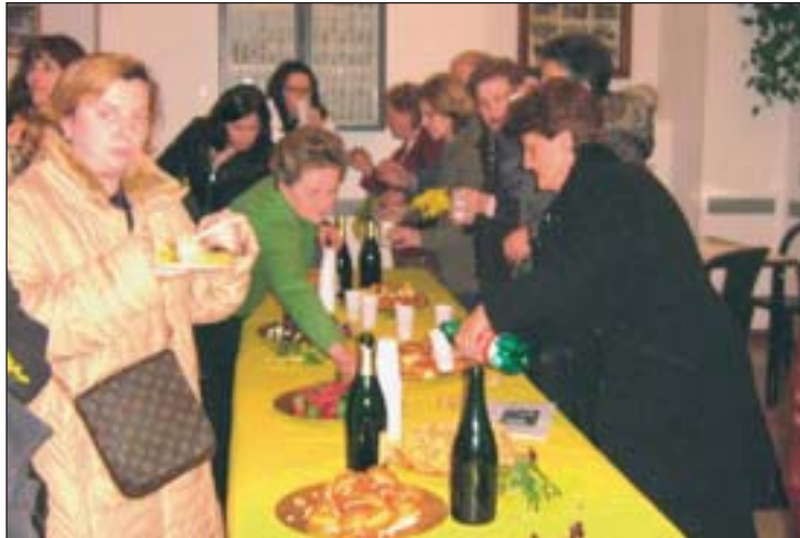
Un momento della serata promossa dal Comune e dall'Avisco

T re giorni all'insegna dell'allegria e della spensieratezza hanno caratterizzato «Carnevale per tutti» organizzato in collaborazione tra il Comune di San Paolo, l'Associazione genitori, il Centro Diurno Anziani e l'Oratorio. Il programma, che ha coinvolto grandi e piccini, comprendeva i giorni di sabato 17, domenica 18 e martedì 20 febbraio. Dopo la serata dedicata agli adulti in maschera, domenica ha avuto luogo il «Pranzo di carnevale» che ha visto la presenza di una novantina