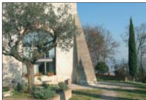
A sinistra, la facciata del santuario e, accanto, l'ingresso all'eremo posizionato in una zona panoramica