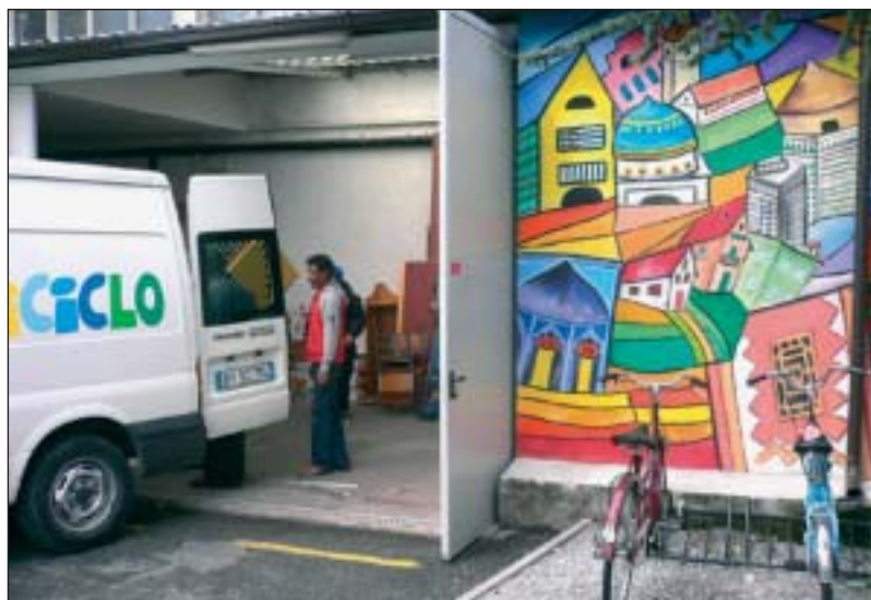
L'ingresso della sede della Comunità Immigrati Ruah Onlus, emanazione del Patronato San Vincenzo, in via Cavalieri di Vittorio Veneto a Bergamo.

Per ulteriori informazioni potete rivolgervi al Laboratorio «Triciclo» via Cavalieri di Vittorio Veneto, 14 Bergamo 035.311914 triciclo@comunitaruah.it www.triciclo-bergamo.net