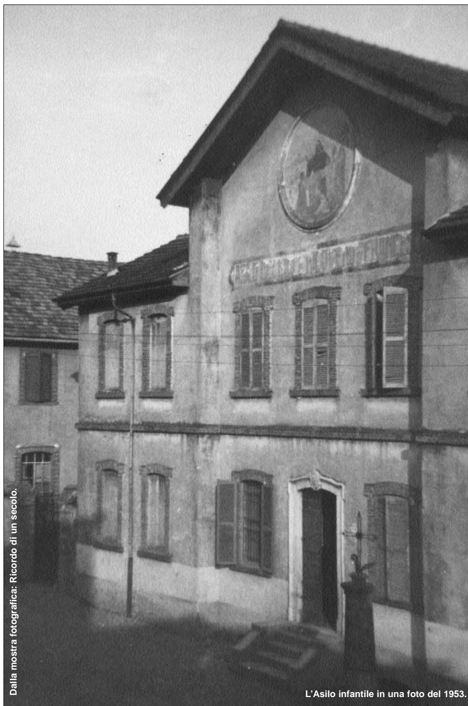
Dalla mostra fotografica: Ricordo di un secolo.