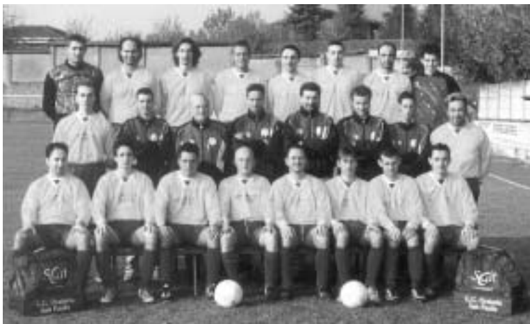
G.G. Oratorio S. Paolo d'Argon, organico 2002-2003

Dall'alto al basso e da sinistra a destra.