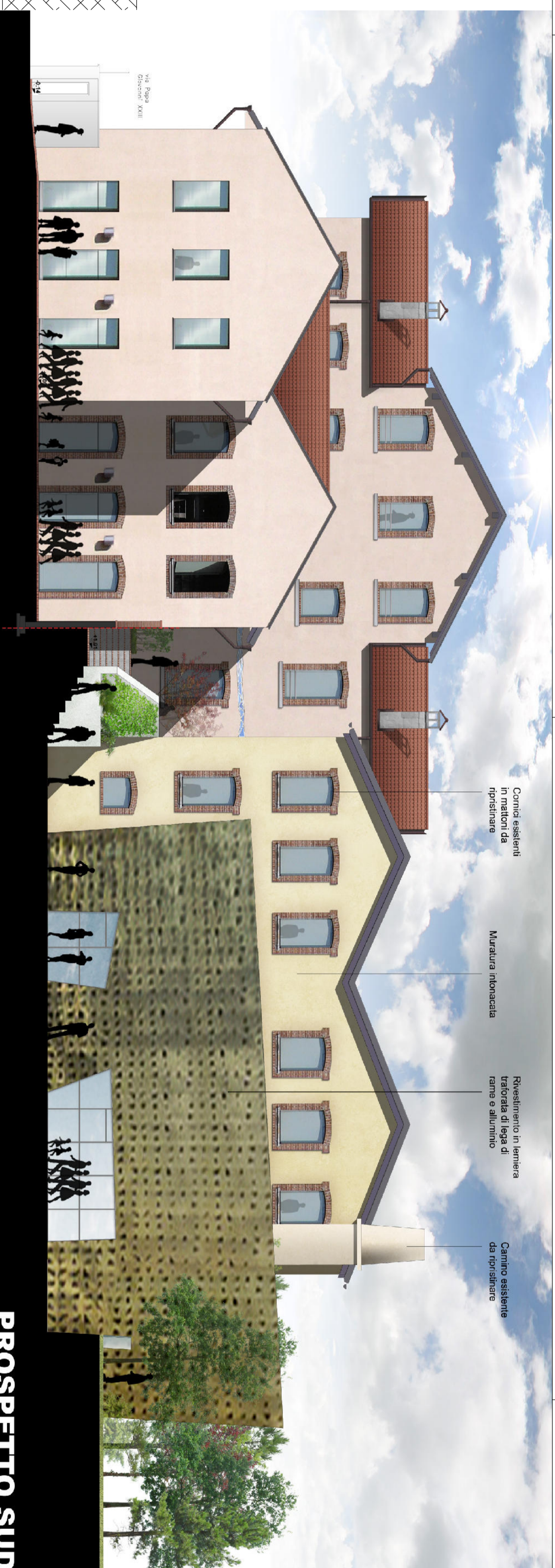
PROSPETTO SUD PROGETTO