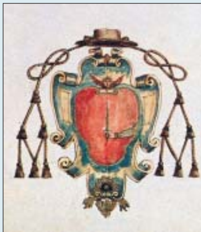
L'antico stemma del monastero tratto dal cabreo del 1729

L'antica chiesa dei cluniacensi risulta insufficiente e viene completamente rifatta. Il nuovo progetto viene affidato nel 1684 dall'abate Massimo Gervasio da Belluno all'architetto luganese Domenico Messi: le tre navate antiche vengono eliminate e si realizza un'unica aula. L'interno della chiesa è un eccezionale esempio di decorativismo seicentesco, con marmi, sculture, affreschi e tele pre-