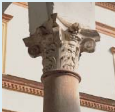
Uno dei capitelli del chiostro minore

- verranno sistemate le facciate est ed ovest;