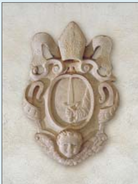
Lo stemma in marmo raffigurante la spada di San Paolo

La Fondazione Bernareggi, che ha curato per conto della Diocesi di Bergamo