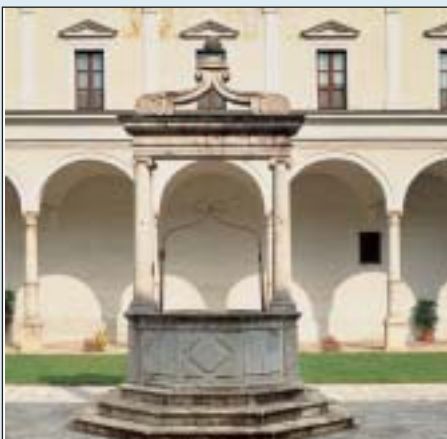
Il pozzo al centro del chiostro maggiore