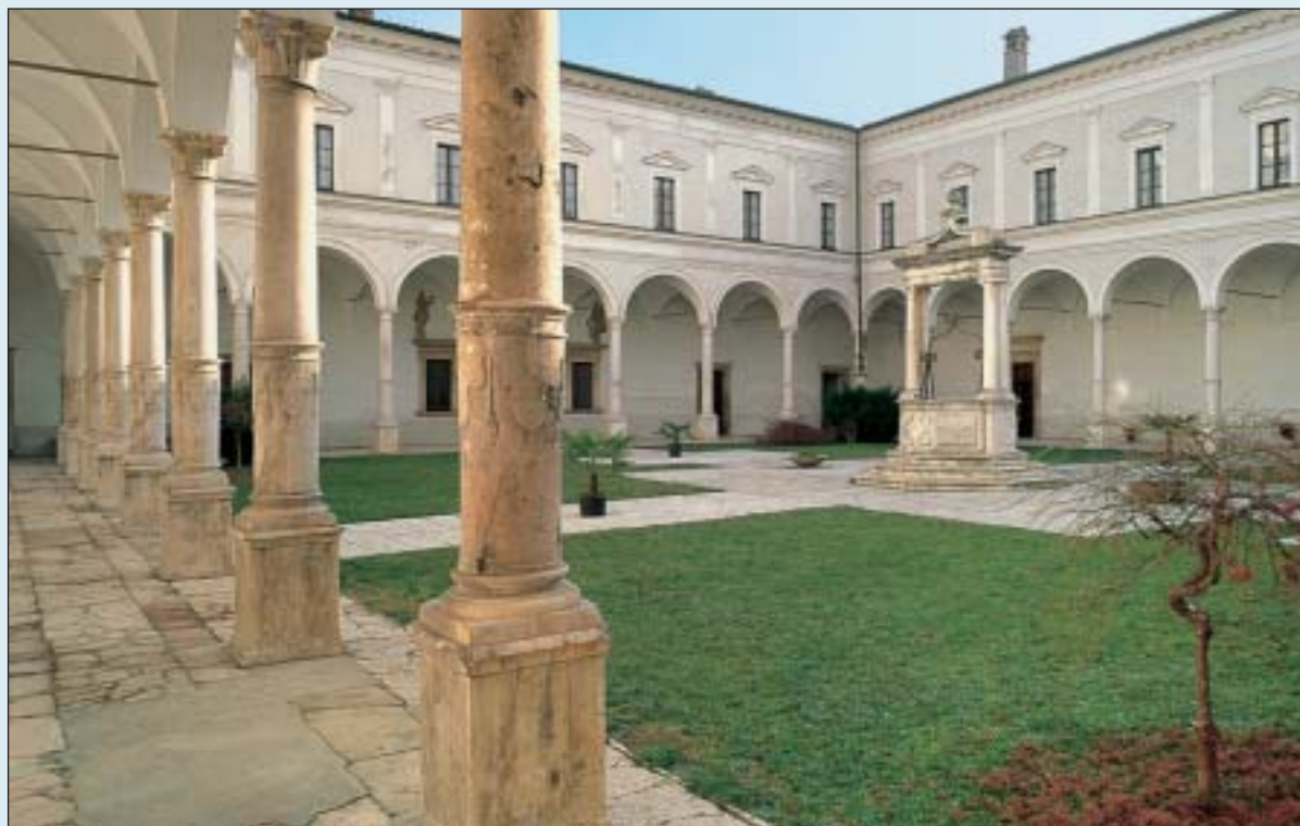
Il chiostro maggiore del monastero