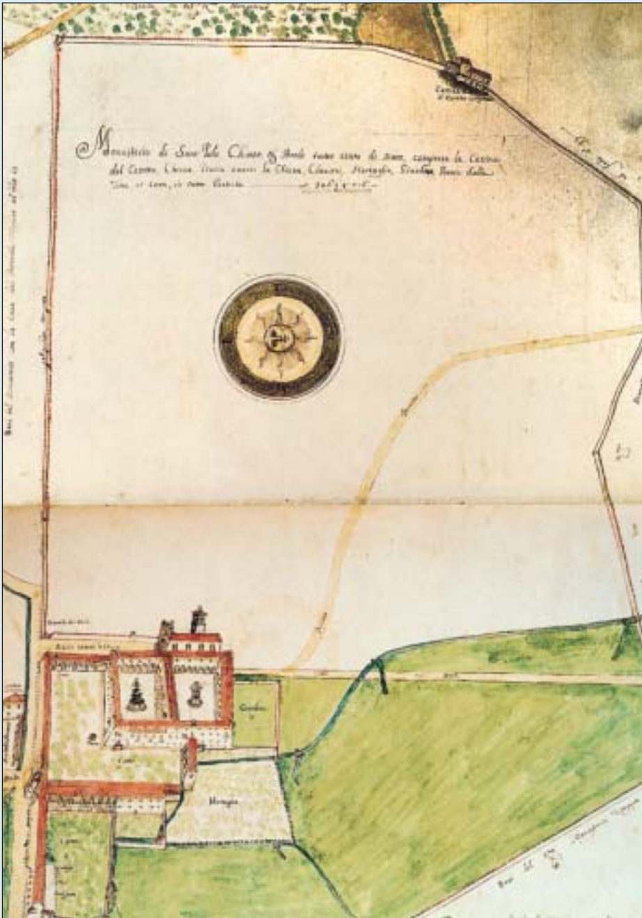
La pianta del monastero nel cabreo del 1729