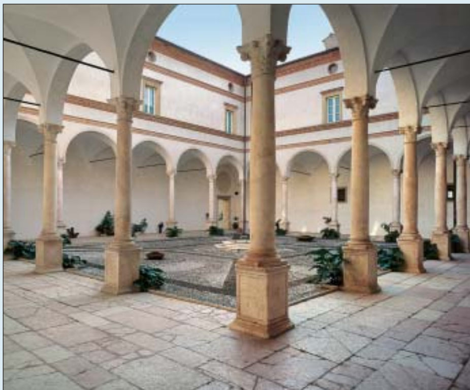
Il chiostro minore del monastero

Il recupero del monastero benedettino rappresenta un evento di straordinaria rilevanza sia territoriale che locale: il monastero benedettino è stato infatti sin dalla sua edificazione indissolubilmente legato alla comunità di San Paolo d'Argon, che proprio intorno all'attività del complesso monastico ha conosciuto un suo primo sviluppo nei secoli scorsi.