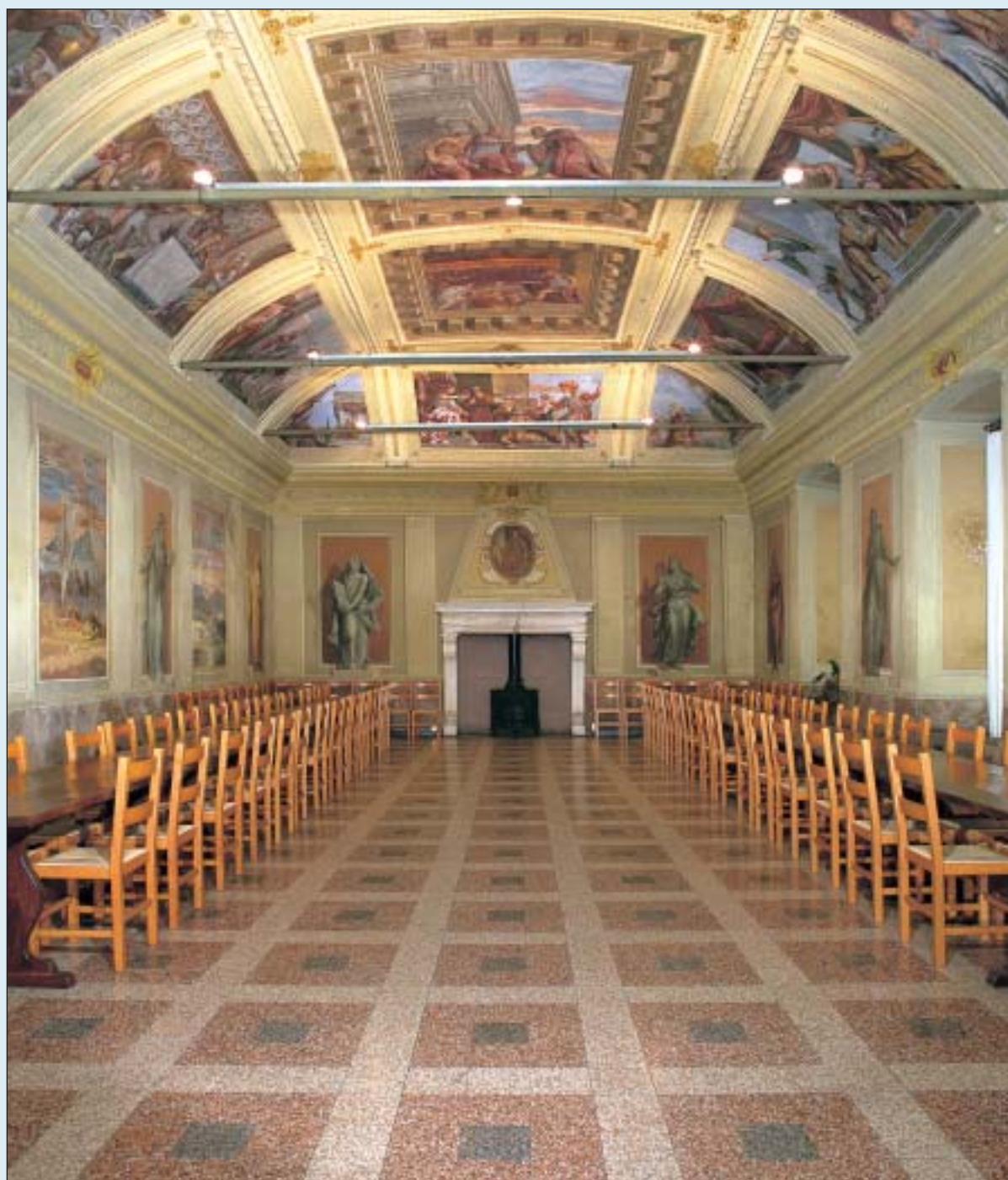
Il refettorio comunitario realizzato nel 1599 e decorato da Giambattista Lorenzetti nel 1624

- essere presente nel Collegio di Vigilanza dell'Accordo di Programma e pertanto avere la possibilità di verificare l'attuazione dell'Accordo e di approvare