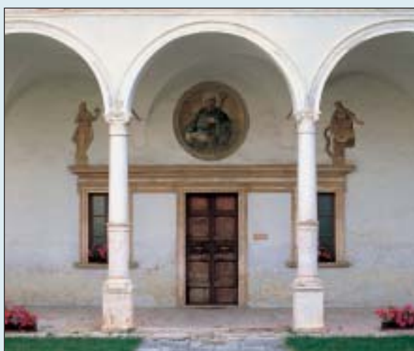
L'ingresso della sala capitolare nel chiostro maggiore

Pensare ai cittadini stranieri in Bergamo significa agire per sviluppare, rafforzare e proiettare nel futuro la loro appartenenza al territorio, alla cultura e alla produzione bergamasca, della quale essi devono sentirsi sempre più parte integrante, valorizzando la grande ricchezza di risorse immateriali, che anch'essi portano in dote (che si riassume, in sostanza, nel loro potenziale di terminali in terra di Bergamo di e verso una serie numerosa di realtà estere estremamente interessanti). Investire sul rapporto coi cittadini stranieri in Bergamo, significa dunque consolidare le possibilità che la nostra provincia ha sempre dimostrato di assimilare culturalmente ed economicamente quanti arrivano dall'esterno e al tempo stesso favorire con ulteriori opportunità l'orientamento verso l'export sui nuovi mercati.