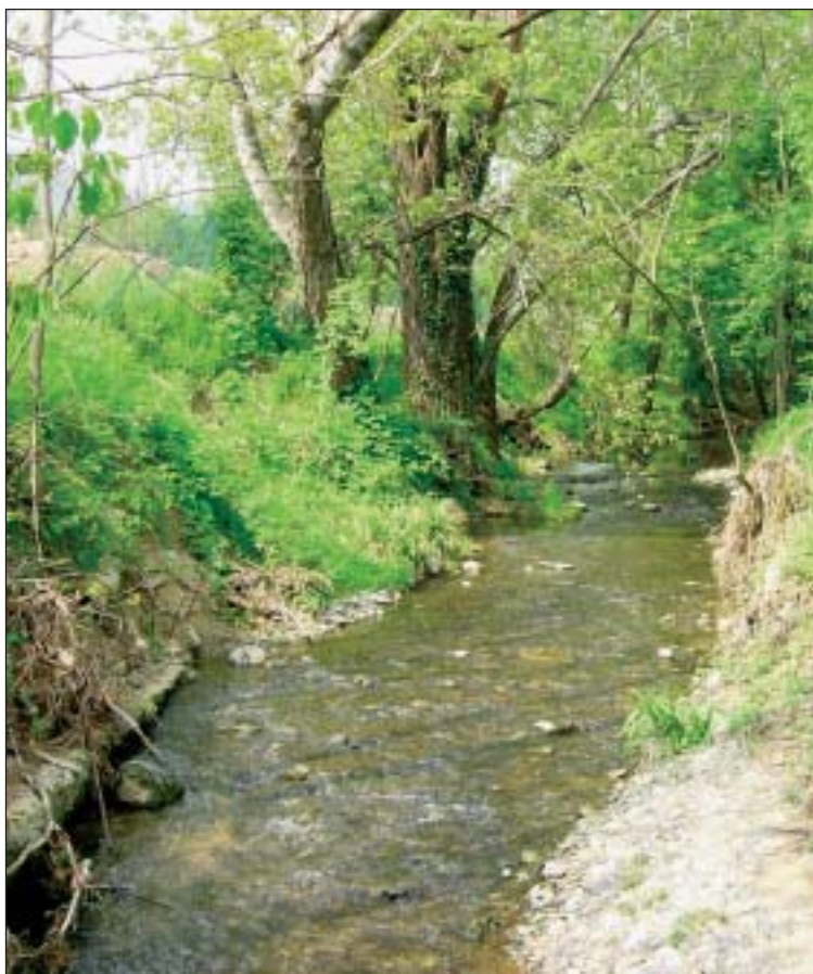
Il torrente Seniga oggetto dei prossimi interventi

Lavori di realizzazione palestra scolastica. Importo complessivo: € 1.000.000,00. Fonte di finanziamento: Mutuo e contributi. È stato redatto e depositato il progetto definitivo. È stata presentata richiesta di finanziamento regionale e statale.